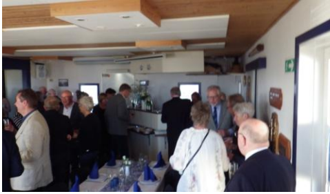
vi fredag den 4. maj Den tøj