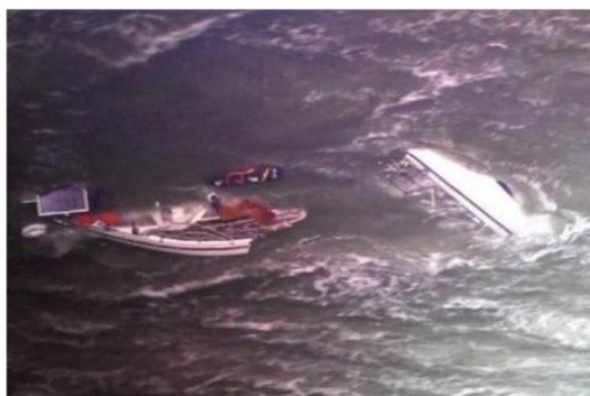
Sådan kan det gå når et ror knækker af i kraftig pålandsvind.

Forlis og ulykker på havet drøftes tit. Aktuelle ulykker på havet – og også hændelser inde i fjordene, har været drøftet. F.eks. et nyligt forlis i løbet af sommeren af en mellemstor sejlbåd på den franske nordkyst i hårdt vejr og i klippefyldt og stenfyldt farvand (ved ebbe ses sandbanker mellem stenene). Skipperen sejlede alene fra Danmark med mål at gå til Syd Amerika (Chile) og på vejen nå havnen ved Bai de la Seine (Le Havre – Cherbourg området), men nåede ikke så langt, da roret på sejlbåden (en 31 fods sejlbåd af typen B31, der ellers har ror med 'skæg' der beskytter ror og rorstamme) blev revet af – formodentlig ved en af de utallige store sten. Han blev reddet i sidste minut v.h.a. helikopter af den franske kystvagt efter at han havde kaldt S.O.S. over VHF-radioen. Sejlermagasinet Min Baad havde en artikel om forliset. Her bringes et markant billede af den forliste båd set fra helikopteren. Forlis stedet er midt i søkortet (CPN 1.3.3) inde bag bøje no 3 og 5.