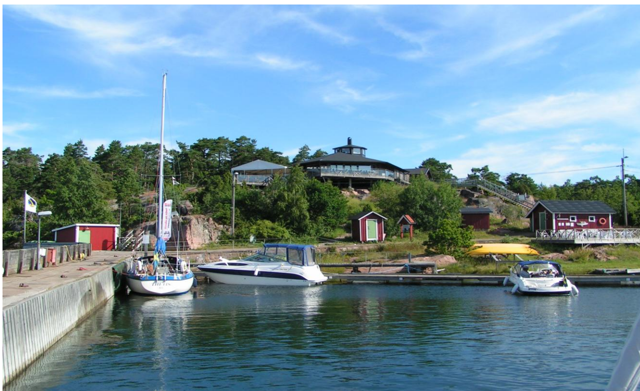
Havnen på Idö

Men, jeg kom en sen aften på en Sveriges sejlads over til et smukt sted lige syd for Vestervig: Idö, som har en ganske lille havn. Hamnkaptenen kom ned for at hjælpe mig med at fortøje. Så spørger han: "Är du ensam seglar?" Ja. "Varför är du det?" Kan du holde på en hemlighed? "Javist" siger han. Og jeg siger sagte: Ingen diskussioner! Han skrattede højt! Umiddelbart betydeligt hævet over havnen oppe på klippen er der en rigtig skægårdsrestaurant med en formidabel udsigt. Jag frågar honom: Er restauranten stängt? Näj inte als der är oppet till kl.23 på kvällen."För mat – javist till kl. 23" Så jeg gik op og fik en plads ved vinduet hvor jeg kunne titta ned på min liten båt. Og jeg krævede bare vildt ind hvad jeg havde lyst til. Pragtfuldt! Så er noget af spørgsmålet måske besvaret?