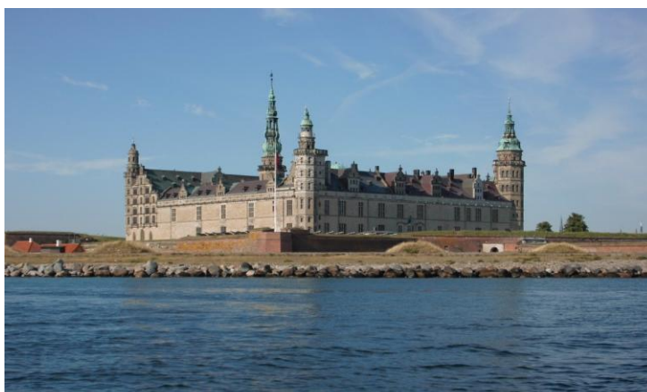
Kronborg fra søsiden er ganske malerisk - og fotogen!

Det var meget morsomt! Jeg sejlede herfra Frederiksværk en eftermiddag kl.16 og gik ind i Gilleleje da klokken var 21.30 om aftenen. Havnen var stort set fyldt med både. Der lå en Najade 371 som jeg lagde mig på siden af. Et ungt par der tog imod mig og hjalp med fortøjningen, sidenhen kom selve skipper på dækket – det var en midaldrende dame. Hun havde sin datter og hendes familie med som gaster og indikerede at hun selv havde mistet sin mand for et par år siden. Hende og hendes mand havde fået båden direkte fra værftet på Orust 1986. Teakdæk, aptering m.m. havde de selv klaret da manden var bådebygger. Båden hørte til Svanemøllehavnen, sejlforeningen 'Sundet'. Jeg fik vist selv forklaret at jeg næsten har været skipper på en båd magen til dog uden det gjorde det store indtryk.