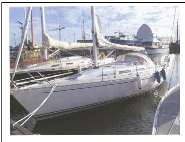
Scampi 29 øverst og Impala 36

Lidt om min sejlkarriere: Sideløbende med min læretid på Maskinfabrikken "Vølund" gennemførte jeg en 2-årig sejleruddannelse hos Sundby Sejlforening afsluttende i 1961 med en 'Førerprøve Attest'. Den praktiske prøve foregik fra Svanemøllehavnen i en for mig fremmed båd: Sejlklubben FREM's øvelsesbåd der var en gaffelrigget Kragejolle uden nogen form for motor til fremdrift.