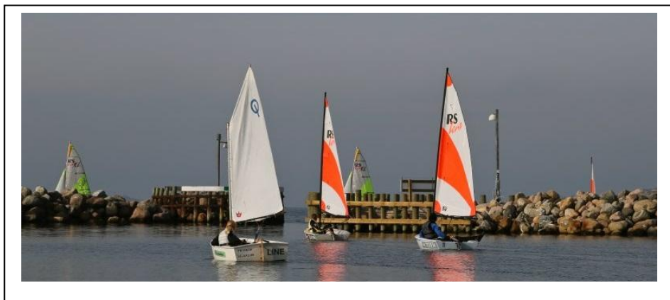
Aftenmatch i Juniorafdelingen