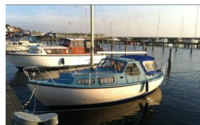
Eksempel på en LM 23 motorsejler

Jeg boede i Roskilde på det tidspunkt. Vi havde sommerhus i Asserbo, så det passede fint. Jeg startede i Sejlklubben og i haven som andelshaver i 2002 og det var med den lille båd. Jeg måtte så 'futte' til Færøerne, det var i 2005, og solgte