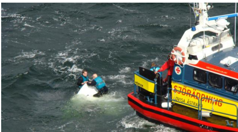
Svensk søredning efter pludselige voldsomme vindstød, der fik den mindre båd til at kæntre. En alt for hyppig situation ifgl. SSRS

Andre radio kommunikationsformer er også tit nævnt som livliner til land med større rækkevidde, men kræver certifikat (og viden) at benytte.