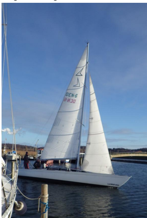
Langø 999 'Neglfar'