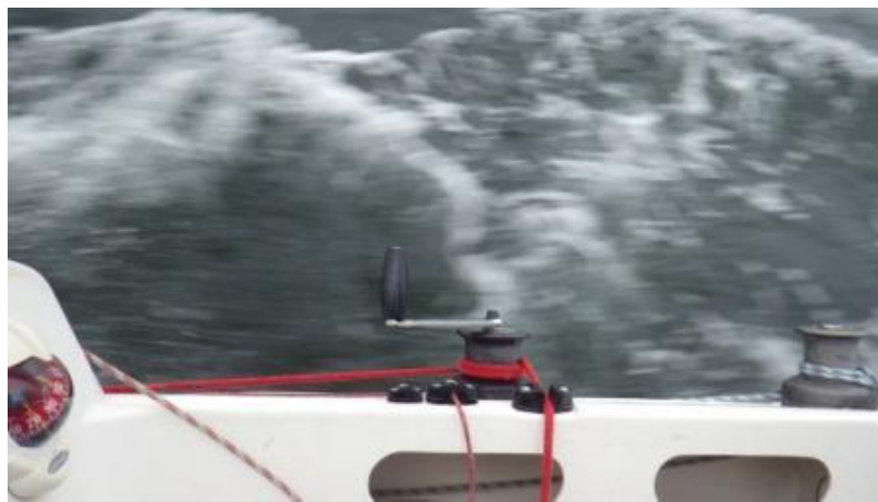
Ca. 7,5 knob set fra siden